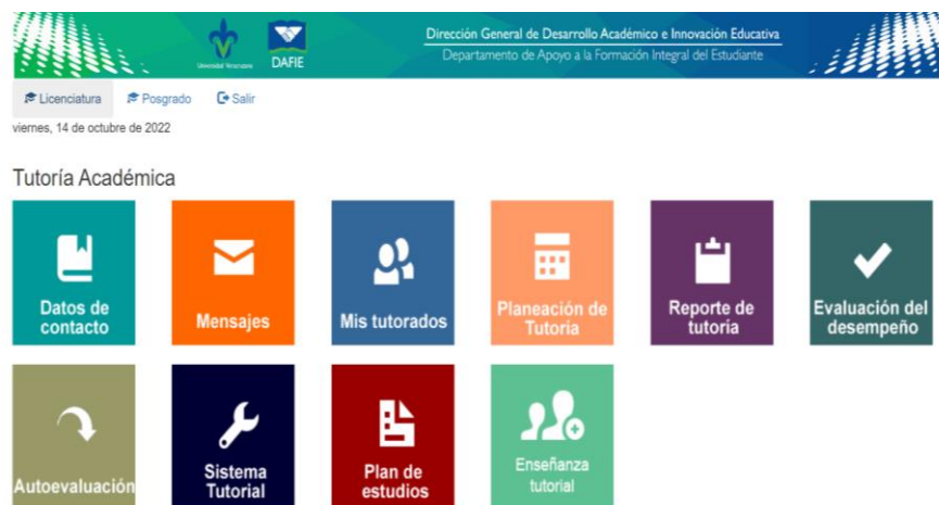
Figura 5.1 Sistema Institucional de Tutorías

Asimismo, en la Plataforma Institucional EMINUS los tutores también cuentan con un espacio para mantenerse en contacto con sus tutorados, publicar información relacionada con el plan de estudios, enviar mensajes, planificar eventos, compartir videos, salón de eventos y espacio de colaboración. (Fig. 5.2).